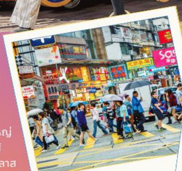
Free time Shopping