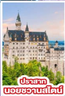
ปราสาท นอยชวานสไตน์