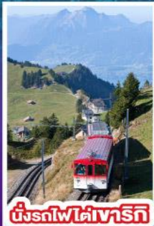
นั่งรถไฟใต้เทรริทิ