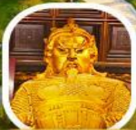
วัดเขากงหนิว