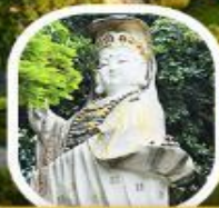
เจ้าแม่กวนอิม ธิพัลส์ เบย์