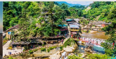
หมู่บ้าน Cat Cat

*ทางบริษัทฯ ขอสงวนสิทธิ์ในการสลับโปรแกรมทัวร์ตามความเหมาะสมขึ้นอยู่กับสถานการณ์ทำงาน โดยคำนึงถึงผลประโยชน์ของลูกค้าเป็นสำคัญ