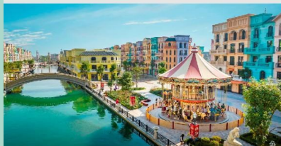
Mega World Hanoi