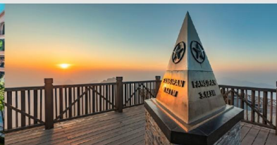
ยอดเขาฟานซิปิน