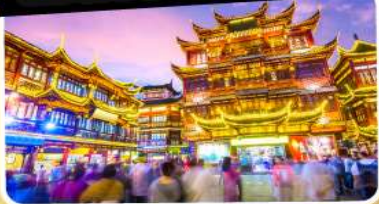
ตลาดร้อยปีเจิ้งหวงเมี่ยว