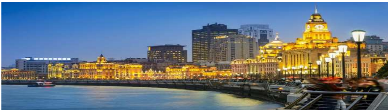
GO1PVG-CA005 ตะลอนเซี่ยงไฮ้ ปักกิ่ง 6วัน 4คืน (นั่งรถไฟความเร็วสูง) โดยสายการบิน Air China (CA)

07.00 น. เดินทางถึง ท่าอากาศยานนานาชาติเซี่ยงไฮ้ผู้ตง ประเทศจีน เวลาท้องถิ่นเร็วกว่าประเทศไทย 1 ชั่วโมง (เพื่อความสะดวกในการนัดหมาย กรุณาปรับนาฬิกาของท่านเป็นเวลาท้องถิ่น) หลังจากท่านได้ผ่านพิธีการตรวจคนเข้าเมืองและศุลกากร