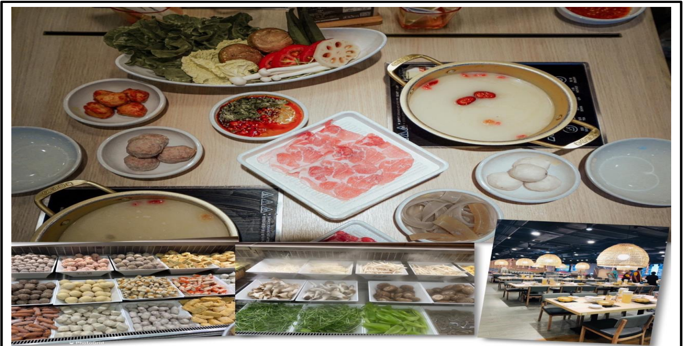
เที่ยง รับประทานอาหารเที่ยง ณ ภัตตาคารไอ. (5) เมนูชาบู