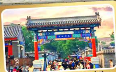
ถนนโบราณหนานหลวู่เซียง