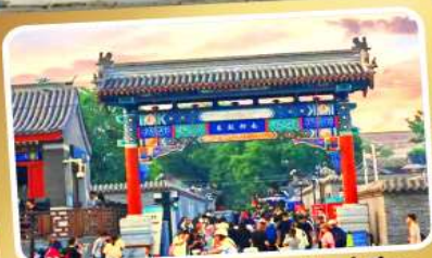
ถนนโบราณหนานหลัวกู่เซียง