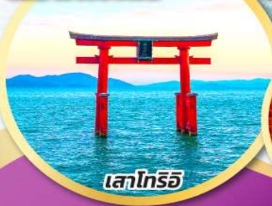
เลาโทริอิ