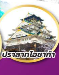
ปราสาทโอซาก้า