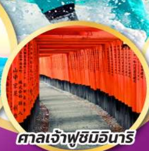
ศาลเจ้าฟูชิมิอินาริ