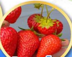
กิจกรรมเก็บ สตอร์วเบอร์รี่

เดินทาง 17-22, 24-29 ม.ค. 68 31 ม.ค.-05 ก.พ. 68 04-09, 07-12 ก.พ. 68 (วันหยุดวันมาฆบูชา) 14-19, 21-26 ก.พ. 68 04-09, 07-12, 11-16 มี.ค. 68