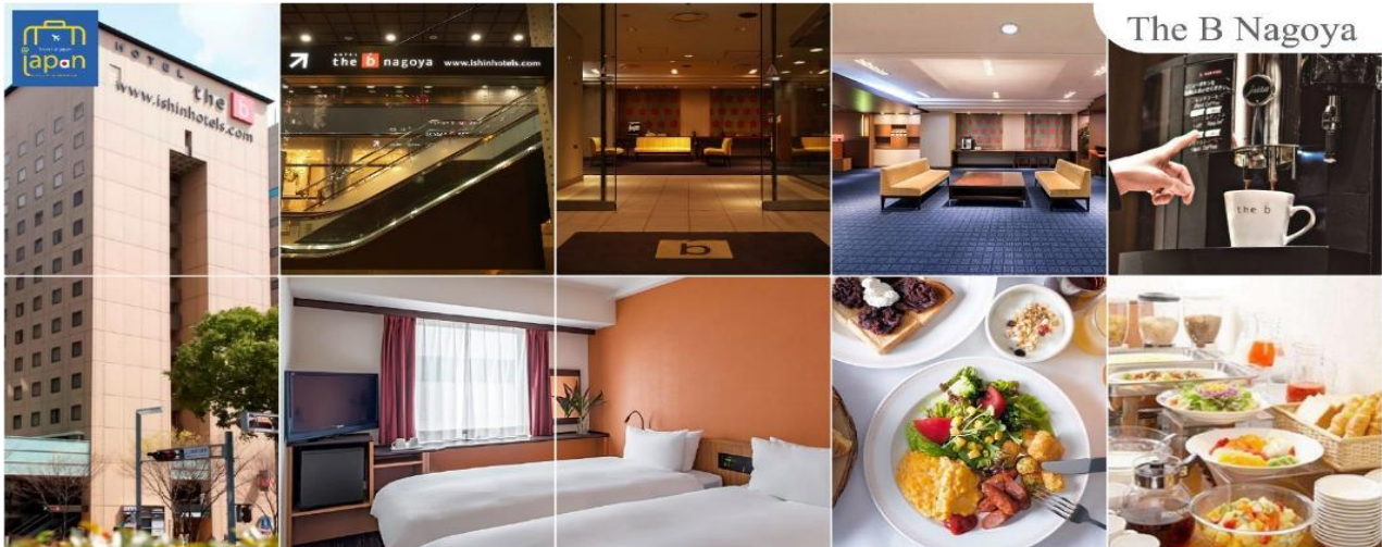
The B Nagoya

เย็นที่พัก อีสาระรับประทานอาหารเย็นตามอัธยาศัย THE B NAGOYA หรือเทียบเท่าระดับเดียวกัน