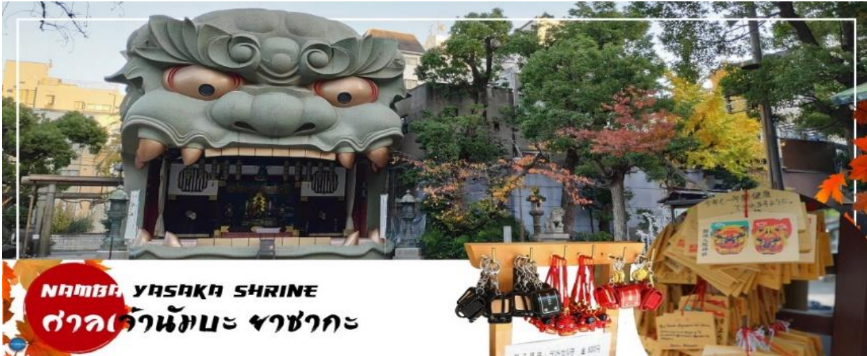
NAMBA YASAKA SHRINE ศาลเจ้านัมมะ ยะซากะ

เที่ยง รับประทานอาหารกลางวัน ณ กัดดาการ (6)