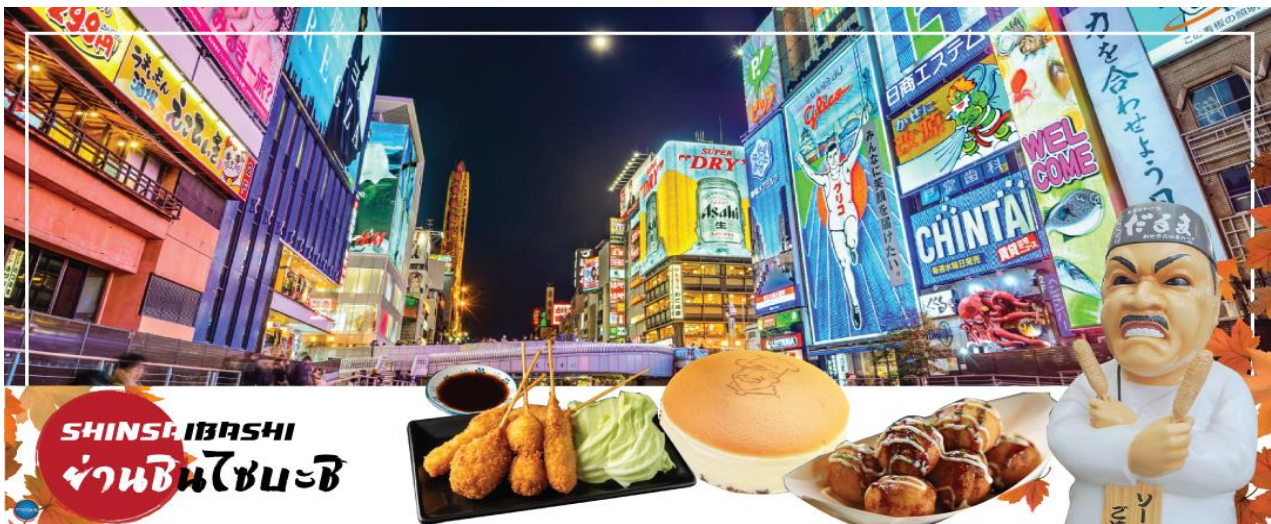
SHINSAIBASHI ย่านชินไซบาชิ

นำทุกท่านเช็คอินจุดถ่ายรูปที่ ศาลเจ้านัมมะยะซากะ (Namba Yasaka Shrine) ตั้งอยู่ในย่านนัมมะของเมืองโอซาก้า ไฮไลท์ของศาลเจ้าแห่งนี้ คือรูปปั้นหน้าสิงโตอ้าปากขนาดใหญ่ ที่เชื่อกันว่า สามารถกลืนกินปีศาจร้าย หรือ สิ่งไม่ดีทั้งหลาย ให้หายไป และนำพามาซึ่งความโชคดีให้แก่ผู้คน ปัจจุบันนักเรียน นักศึกษา และผู้ประกอบการธุรกิจนั้น นิยมมาขอพรให้ประสบความสำเร็จกันที่นี่ ด้วยความสูง 17 เมตร ความกว้าง 11 เมตรและความลึก 7 เมตร อีสระให้ทุกท่านสักการะ และเก็บภาพที่ ศาลเจ้านัมมะ ยะซากะ