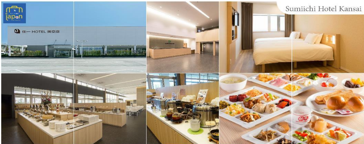
Sumiichi Hotel Kansai

พักที่ SUMIICHI HOTEL KANSAI หรือเทียบเท่าระดับเดียวกัน (โดยรถบัสโรงแรม)