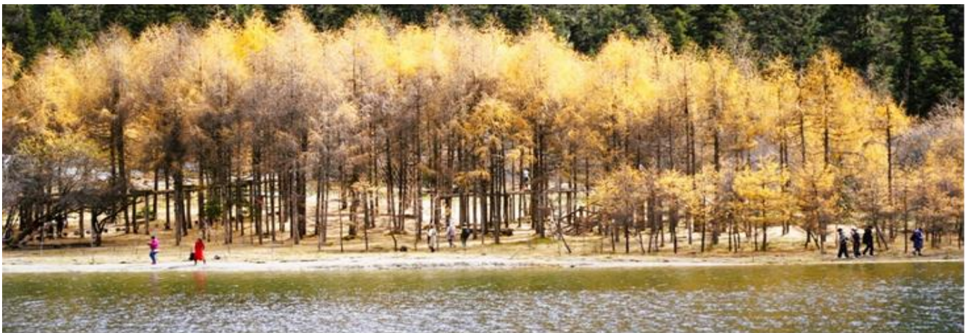
GO1TFU-MU101 เมือง จี๋จ้ายโกว หวงหลง ปีเฝิงโกว สี่ครุณี 7วัน 6คืน โดยสายการบิน Air China (CA)

กลางวัน บริการอาหารกลางวัน ณ ภัตตาคาร (มือที่ 11)