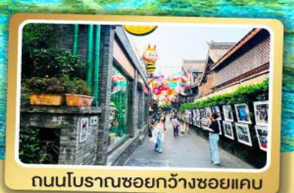
ถนนโบราณชอยกว้างชอยแคบ