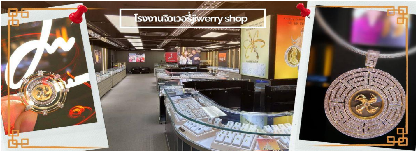
โรงงานจิวเวอรี่ jewelry shop

จากนั้นนำท่านชม โรงงานจิวเวอรี่ ซึ่งเป็นโรงงานที่มีชื่อเสียงที่สุดของฮ่องกงในเรื่องการออกแบบเครื่องประดับ อาทิเช่น จี้ และแหวนกั้งหัน ที่สวยงามโดดเด่นไม่เหมือนใคร ซึ่งถือกำเนิดขึ้นที่นี่และมีชื่อเสียงที่สุดใช้เป็นเครื่องประดับติดตัว และเสริมดวงชะตาสินค้าทุกชิ้นมีเอกสารรับประกันคุณภาพเปลี่ยน ซ่อม ได้ตลอดอายุการใช้งาน หากเกิดการชำรุดจากสินค้าไม่ใช่อุบัติเหตุ และนำท่านเลือกซื้อ เครื่องประดับที่ ร้านหยก ซึ่งคนจีนนั้นถือว่าหยกเป็นหิน ที่เป็นตัวแทนของความสวยงามและความบริสุทธิ์ มีความเชื่อว่าหยกมงคล ถ้าพกติดตัวไว้จะอายุยืนและสุขภาพดี