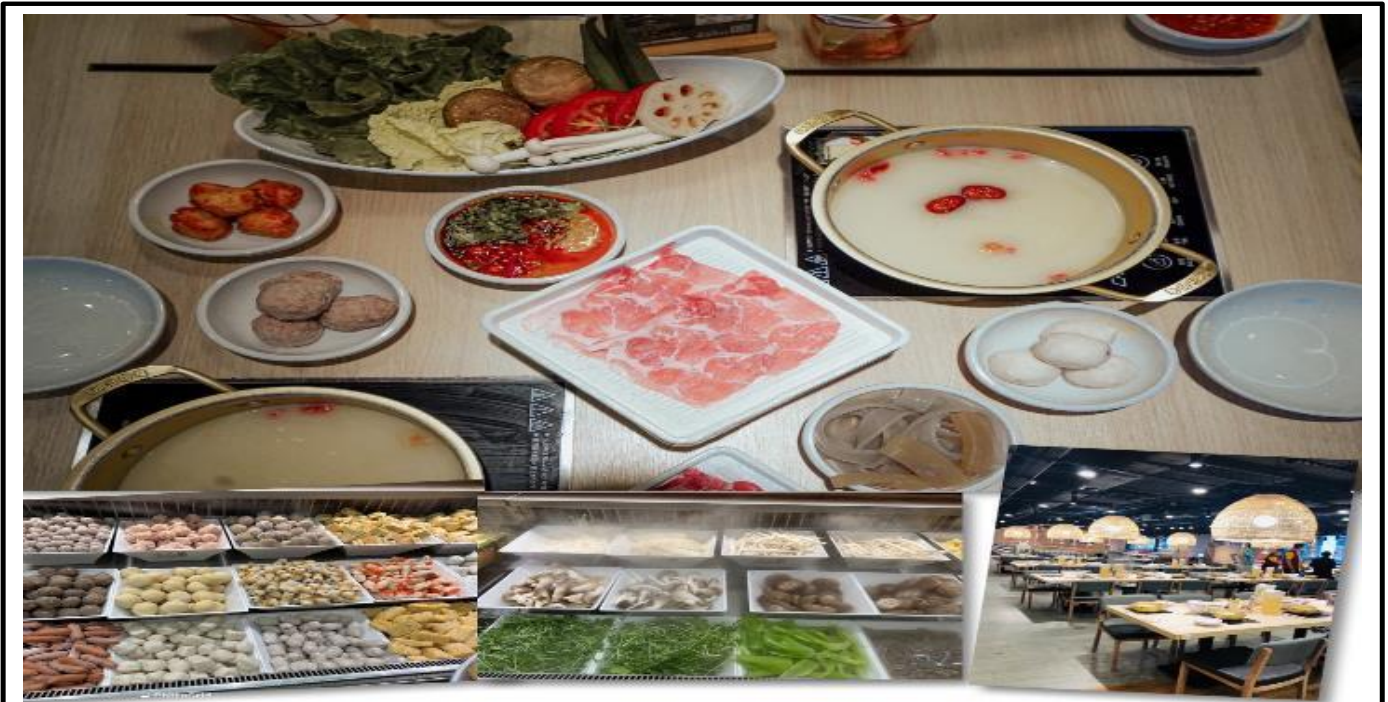
เทียง รับประทานอาหารเทียง ณ ภัตตาคารไอ (5) เมนูชาบู