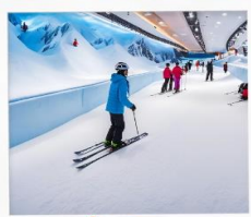
บ้านหิมะ WINDOW OF THE WORLD