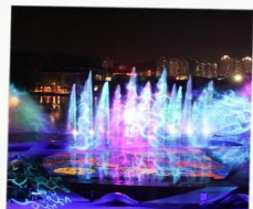
โชว์ม่านน้ำสามมิติ OCT BAY WATER SHOW