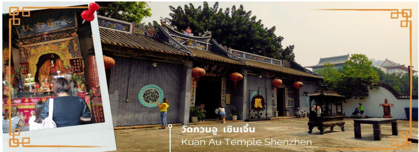
วัดกวนอู เซินเจิ้น Kuan Au Temple Shenzhen

เช้า 🍲 บริการอาหารเช้า ณ ห้องอาหารของโรงแรม (3) จากนั้นนำท่านเดินทางสู่ วัดกวนอู ไหว้เทพเจ้ากวนอู สัญลักษณ์ของความซื่อสัตย์ ความกตัญญูรู้คุณ ความจงรักภักดี ความกล้าหาญ โศคลาภ และบารมี ท่านเปรียบเสมือนตัวแทนของความเข้มแข็งเด็ดเดี่ยวของอาจไม่ครั้งคร้ามต่อศัตรู ท่านเป็นคนจิตใจมั่นคงตั้งขุนเขา มีสติปัญญาเฉลียวฉลาด และไม่เคยประมาทการบูชาขอพรท่านก็หมายถึงขอให้ท่านช่วยอุดช่องว่างไม่ให้เพรียงพลั่วแก่ฝ่ายตรงข้าม และให้เกิดความสมบูรณ์ด้วยคนข้างเคียงที่ซื่อสัตย์ หรือบริวารที่ไว้วางใจได้นั่นเองตั้งนั้นประชาชนคนจีนจึงนิยมบูชา และกราบไหว้เพื่อความเป็นสิริมงคลต่อตนเอง และครอบครัวในทุกๆ ด้าน