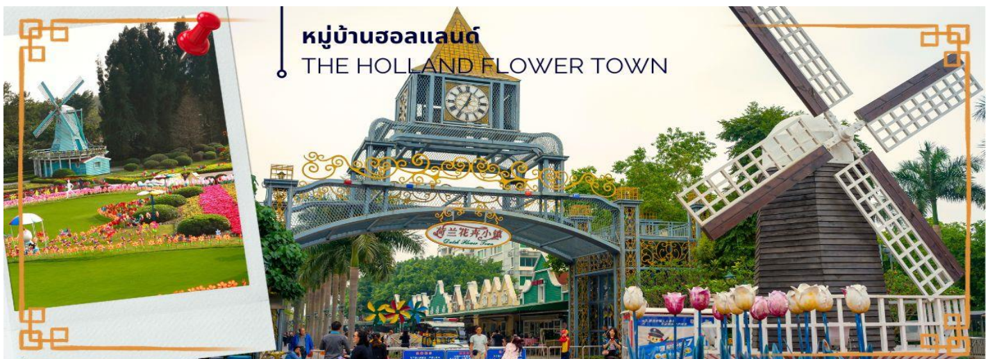
หมู่บ้านฮอลแลนด์ THE HOLLAND FLOWER TOWN

หลังผ่านพิธีการตรวจคนเข้าเมืองเรียบร้อยแล้ว จากนั้นนำท่านเข้าชม หมู่บ้านฮอลแลนด์ (THE HOLLAND FLOWER TOWN) เป็นสวนสาธารณะที่มีร้านค้าไม้พร้อมภูมิทัศน์ที่สวยงามของที่นี่ อาทิเช่นสวนหย่อม น้ำพุ ซึ่งเหมาะกับการถ่ายรูปเป็นอย่างมาก รวมถึงกลุ่มอาคารถนนคนเดิน ที่สร้างด้วยสถาปัตยกรรมแบบทรงบ้านเนเธอร์แลนด์ขนานแท้ ที่ออกแบบหลังคาหน้าจั่วให้ลวดลายไม่ซ้ำกัน อีกทั้งยังมีร้านค้า ร้านกาแฟ ร้านขนมหวาน ให้นั่งชิลเพลิน ๆ กัน โดยแต่ละร้านจะออกแบบให้มีสไตล์ และคงเอกลักษณ์ให้มีบรรยากาศเหมือนเราอยู่ที่เนเธอร์แลนด์ แต่กลมกลืนเข้ากับภูมิทัศน์ล้อมรอบของเมืองเซินเจิ้น