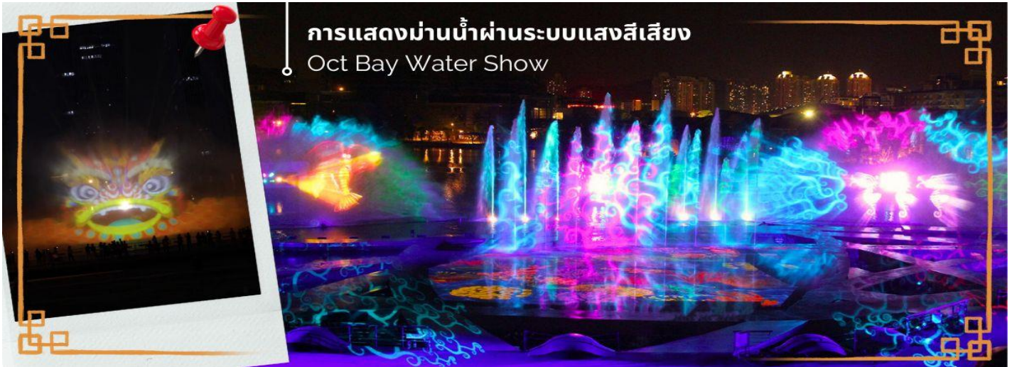
การแสดงม่านน้ำผ่านระบบแสงสีเสียง Oct Bay Water Show

CCXS1 ฮองกง-เซินเจิ้น-ไห่ฟู่ 3 วัดดัง ชมการแสดงโชว์ม่านน้ำ 3วัน 2คืน CX (SEP-MAR25)