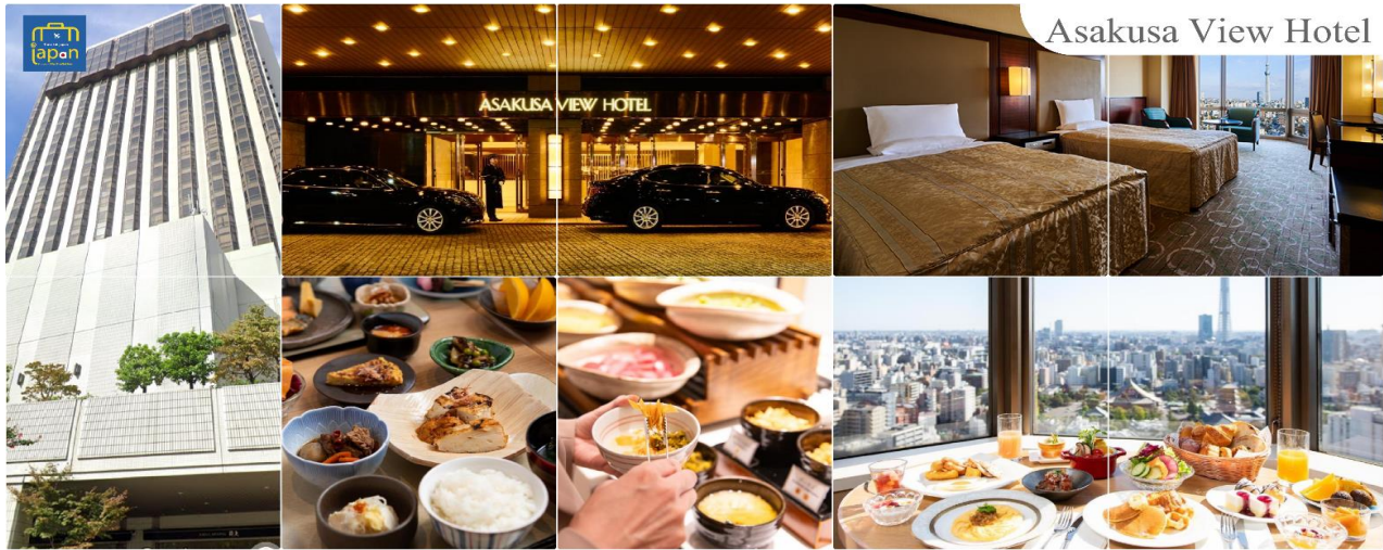
Asakusa View Hotel

วันที่สี่ กรุงโตเกียว – จังหวัดไซตามะ – ย่านเมืองเก่าคาวาโกเอะ – กรุงโตเกียว – ชมมวยยักษ์ 3 มิติ พร้อมช้อปปิ้ง ย่านชินจูกุ