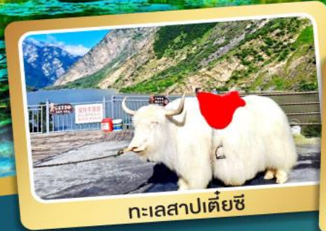
ทะเลสาปเตี้ยซี