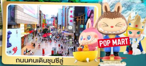
ถนนคนเดินชุนซีลู่