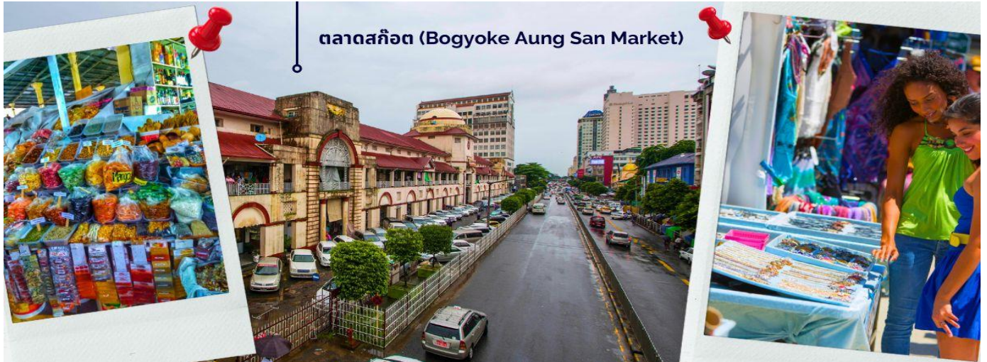
ตลาดสก๊อต (Bogyoke Aung San Market)

ให้ท่านได้มีเวลากับการเลือกซื้อของฝาก ของที่ระลึกต่างๆ ทั้งสินค้าพื้นเมืองที่มีชื่อเสียงของพม่าที่ ตลาดสก๊อต (Bogyoke Aung San Market) นี่คือนตลาดที่ใหญ่ที่สุดในย่างกุ้ง เป็นแหล่งช้อปปิ้งที่มีสินค้าวางขายแทบทุกชนิด เปรียบเสมือนตลาดนัดจตุจักรของบ้านเราก็ดำเนินได้ นอกจากสินค้าพื้นเมืองแล้ว ตลาดแห่งนี้ยังเป็นแหล่งรวมสินค้าประเภทอัญมณีที่เป็นที่รู้จักไปทั่วโลกนั่นคือ หยกพม่า (หากซื้อสินค้าหรืออัญมณีที่มีราคาสูง ควรขอใบเสร็จรับเงินทุกครั้ง เนื่องจากจะต้องแสดงให้เห็นเจ้าหน้าที่ศุลกากรหากมีการขอตรวจสอบ)