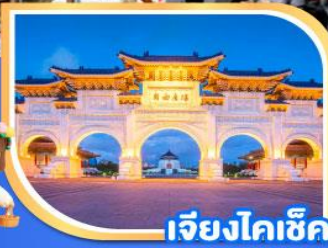
เจียงโกเช็ก