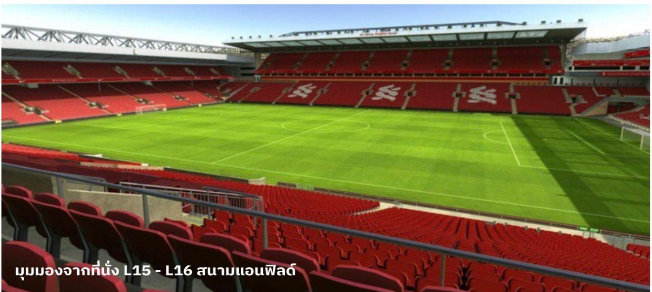
มุมมองจากที่นั่ง L15 - L16 สนามแอนฟิลด์

นำท่านเข้าสู่ที่พัก Mercure Liverpool Atlantic Tower Hotel หรือเทียบเท่า