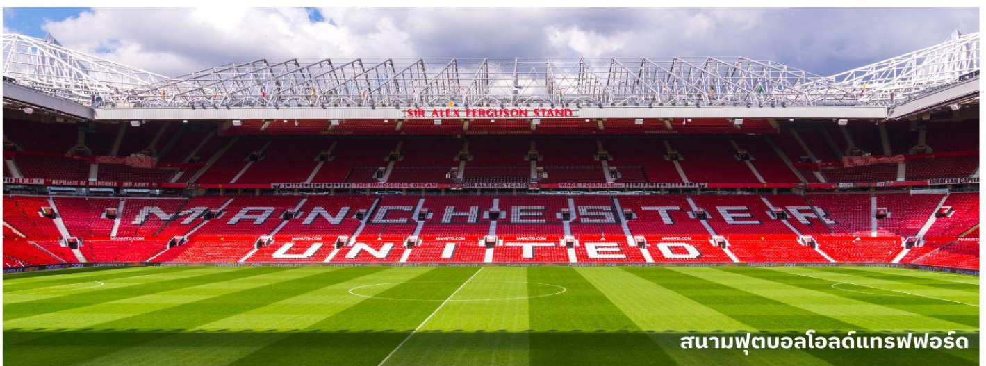
สนามฟุตบอลโอลด์แทรฟฟอร์ด

ให้ท่านได้เที่ยวชมส่วนต่างๆของสนามละประวัติความเป็นมาของสโมสรแห่งนี้ จากนั้นอิสระให้ท่านเลือกซื้อของที่ระลึกของทีมสโมสรแมนเชสเตอร์ยูไนเต็ด ในร้าน MEGA STORE ที่มากมายไปด้วยของที่ระลึกหลากหลายชนิดสำหรับแฟนบอล