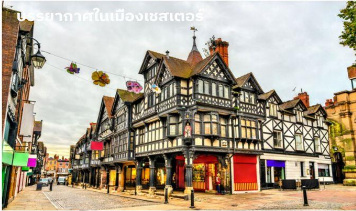
บรรยากาศในเมืองเชสเตอร์

จากนั้นนำท่านเดินทางสู่ เมืองเชสเตอร์ (Chester) ใช้เวลาเดินทางประมาณ 1 ชั่วโมง เชสเตอร์เมืองเก่าที่ค้นพบโดยชาวโรมันเมื่อประมาณ 2,000 ปีมาแล้ว นำท่านผ่านชมตัวเมืองอันสวยงามทางตอนเหนือของแคว้นเวลส์ ลักษณะของสถาปัตยกรรมของอาคารบ้านเรือนเป็นแบบทิวดอร์ อันเป็นเอกลักษณ์เฉพาะของที่นี่โครงสร้างตึกและบ้านเรือนที่จะทำจากไม้และทาสีขาวดำซึ่งจะเห็นได้ทั่วไปแทบจะทุกถนน ซึ่งเสริมให้บรรยากาศของเมืองนี้มีเสน่ห์ และแฝงความน่ารักเอาไว้ นอกจากนี้ตึกบางแห่งยังเป็นตึกเก่าแก่ตั้งแต่สมัยปี ค.ศ.1488 อีกด้วย