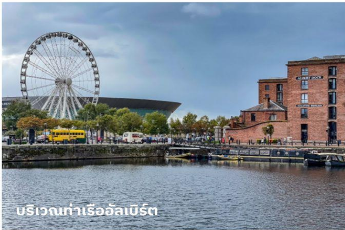
บริเวณท่าเรืออัลเบิร์ต

ใช้เวลาอันสมควรนำท่านสู่สนามบิน เพื่อเตรียมตัวเดินทางกลับประเทศไทย