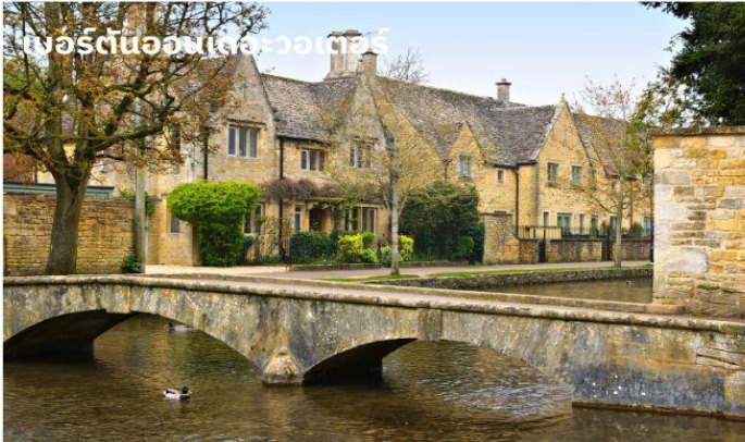
เบอร์ตันออนเดอะวอเตอร์