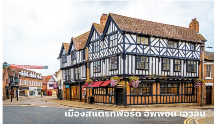
เมืองสเตรทฟอร์ด อัฟฟอน เอวอน

จากนั้นนำท่านเดินทางสู่ เขตคอสโวลส์ เขตหมู่บ้านชนบทแสนสวยของอังกฤษถึง 70 หมู่บ้าน ใช้เวลาเดินทางประมาณ 1 ชั่วโมง นำท่านเที่ยวชม หมู่บ้านเบอร์ตันออนเดอะวอเตอร์ (Bourton On The Water) หมู่บ้านเล็ก ๆ ที่รู้จักกันในนามของ “เวนิส แห่งคอตวอลส์” เมืองที่โด่งดังที่สุดในคอตสโวลส์ ดูเจียบบงบมีลำธารสายเล็ก ๆ (แม่น้ำวินด์ริช) ไหลผ่านกลางเมือง และมีสะพานหินทอดข้ามน้ำเป็นช่วง ๆ กับต้นวิลโลว์ที่แกว่งกิ่งก้านใบอยู่ริมน้ำ