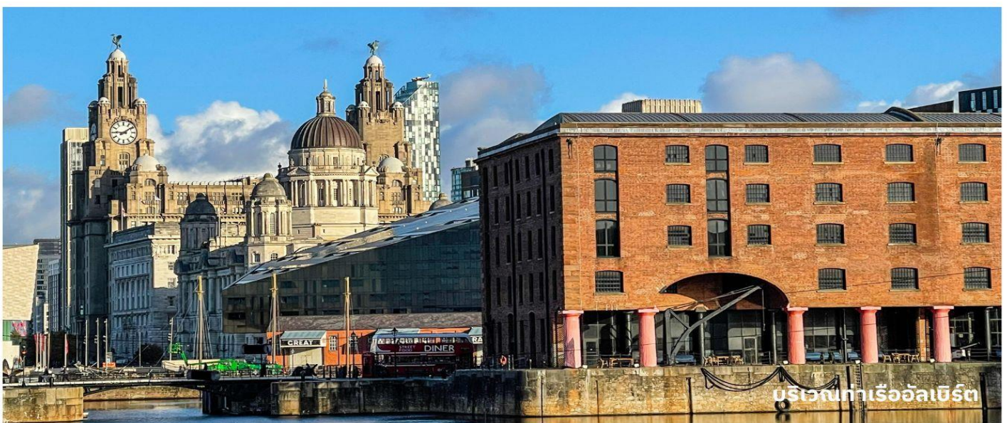
บริเวณท่าเรืออัลเบิร์ต

ออกเดินทางสู่ ดูไบ ประเทศสหรัฐอาหรับเอมิเรตส์ โดยสารการบินเอมิเรตส์ เที่ยวบินที่ EK020 (บริการอาหารและเครื่องดื่มบนเครื่องบิน)