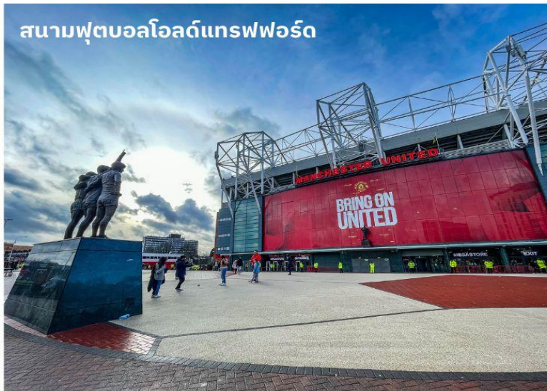
สนามฟุตบอลโอลด์แทรฟฟอร์ด

จากนั้นนำท่านเดินทางสู่ เมืองแมนเชสเตอร์ ใช้เวลาเดินทางประมาณ 1 ชั่วโมง เป็นอีกหนึ่งเมืองท่าที่สำคัญของประเทศอังกฤษและยังเป็นเมืองที่มีประชากรมากที่สุดเป็นอันดับสองของประเทศอังกฤษ รองจากมหานครลอนดอน จากนั้นนำท่านถ่ายรูปด้านหน้า สนามฟุตบอลโอลด์แทรฟฟอร์ด แห่งทีมแมนเชสเตอร์ ยูไนเต็ด สโมสรฟุตบอลชื่อดังโลกที่มีสมาชิกแฟนคลับมากที่สุดในโลก เจ้าของสมญานาม “ปีศาจแดง” สนามเริ่มก่อสร้างในปี 1909 และเริ่มใช้ตั้งแต่ปี 1910 ปัจจุบันมีความจุ 76,212 คน