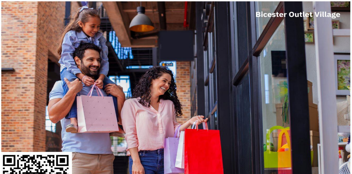
Bicester Outlet Village

จากนั้นนำท่านเดินทางต่อไปยัง บิชสเตอร์เอาท์เล็ต วิลเลจ (Bicester Outlet Village) ใช้เวลาเดินทางประมาณ 1 ชั่วโมง ให้ทุกท่านได้ซื้อสินค้าแบรนด์เนมต่างๆ ทั้งของอังกฤษ เช่น Armani, Bally, Burberry, Calvin Klein, Diesel, Dior, Fendi, Gucci, Guess, Hugo, Boss, Jaeger, Jigsaw, Kipling, L'Occitane, Levi's, Max Mara, Missoni, Molton Brown, Mulberry, Paul Smith เป็นต้น และอื่นๆ อีกมากมายในราคาสบายๆ อีสาระให้ท่านได้เลือกซื้อสินค้าตามอัธยาศัย อีสาระอาหารกลางวันตามอัธยาศัยเพื่อความสะดวกในการช้อปปิ้ง