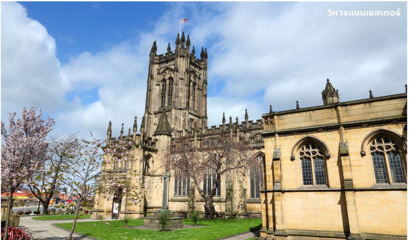
วิหารแมนเชสเตอร์

จากนั้นนำท่านถ่ายรูปเป็นที่ระลึกกับ วิหารแมนเชสเตอร์ (Manchester Cathedral) สร้างขึ้นมาตั้งแต่ปี ค.ศ. 1215 โดยบารอนโรเบิร์ต เกรสเล็ท เจ้าของคฤหาสน์แมนเชสเตอร์ สั่งให้สร้างขึ้นมาข้างกับที่พักของเขา เพื่อใช้เป็นโบสถ์ประจำเขตศาสนาของเมืองแมนเชสเตอร์ ได้รับความเสียหายอย่างหนักจากระเบิดในสงครามโลกครั้งที่ 2 และเมื่อในปี ค.ศ. 1996 ได้ถูกลอบวางระเบิดจากผู้ก่อการร้าย ไออาร์เอ ทำให้ต้องมีการบูรณะใหม่อีกครั้ง แต่ปัจจุบันนั้นก็กลับมาสวยงามดังเดิม และใช้ประกอบพิธีกรรมทางศาสนา รวมทั้งเป็นส่วนหนึ่งของ Church of England ที่หากมาถึงประเทศอังกฤษ