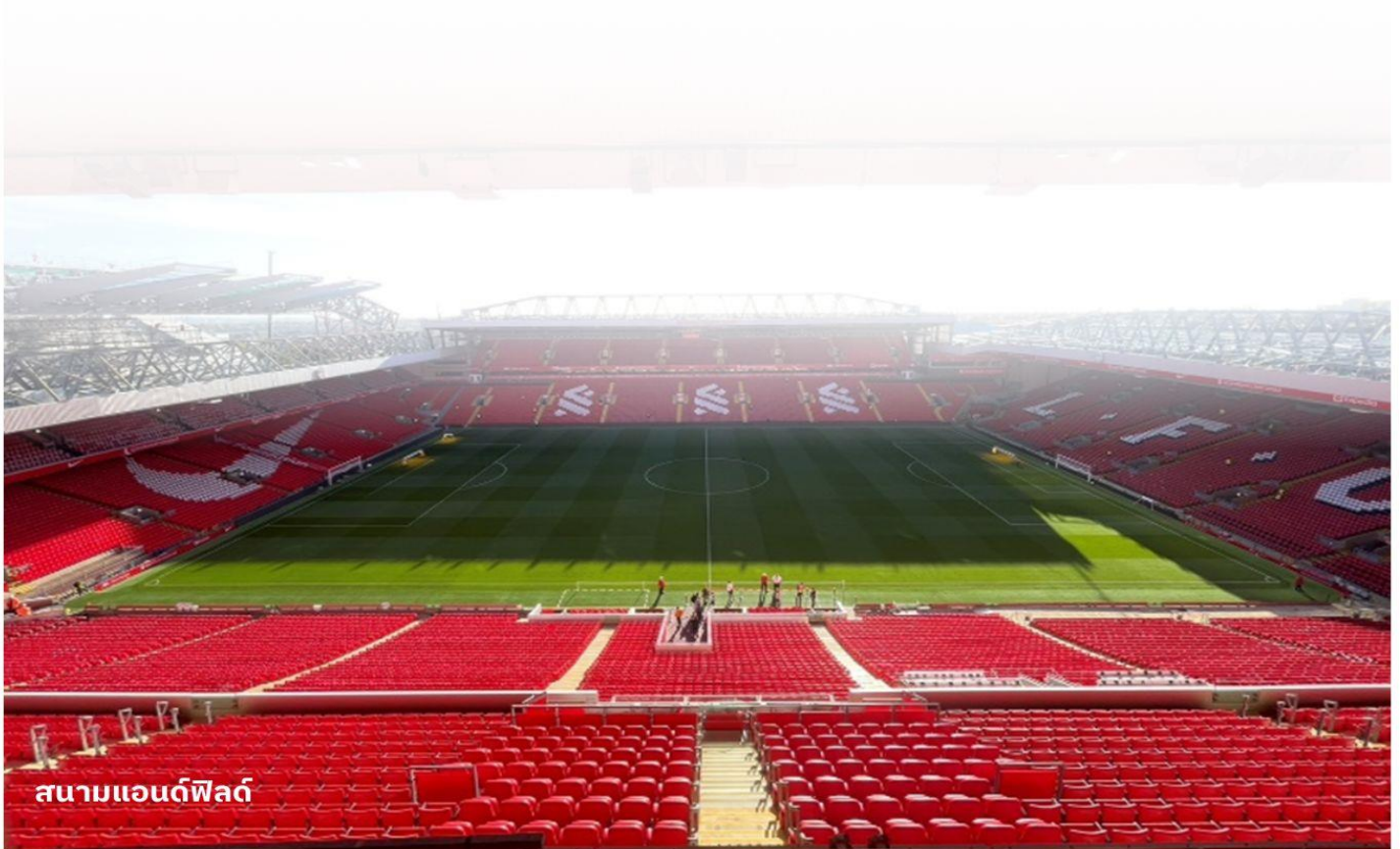
สนามแอนฟิลด์

หนึ่งในสถานที่ท่องเที่ยวที่ใหญ่ที่สุดในเมืองลิเวอร์พูล โดยบริเวณท่าเรือนี้ประกอบไปด้วยอาคารท่าเรือและคลังสินค้านอกจากนี้แล้วท่าอัลเบิร์ตยังเป็นสถานที่ท่องเที่ยวที่มีคนเข้าชมมากที่สุดในสหราชอาณาจักรอีกด้วย