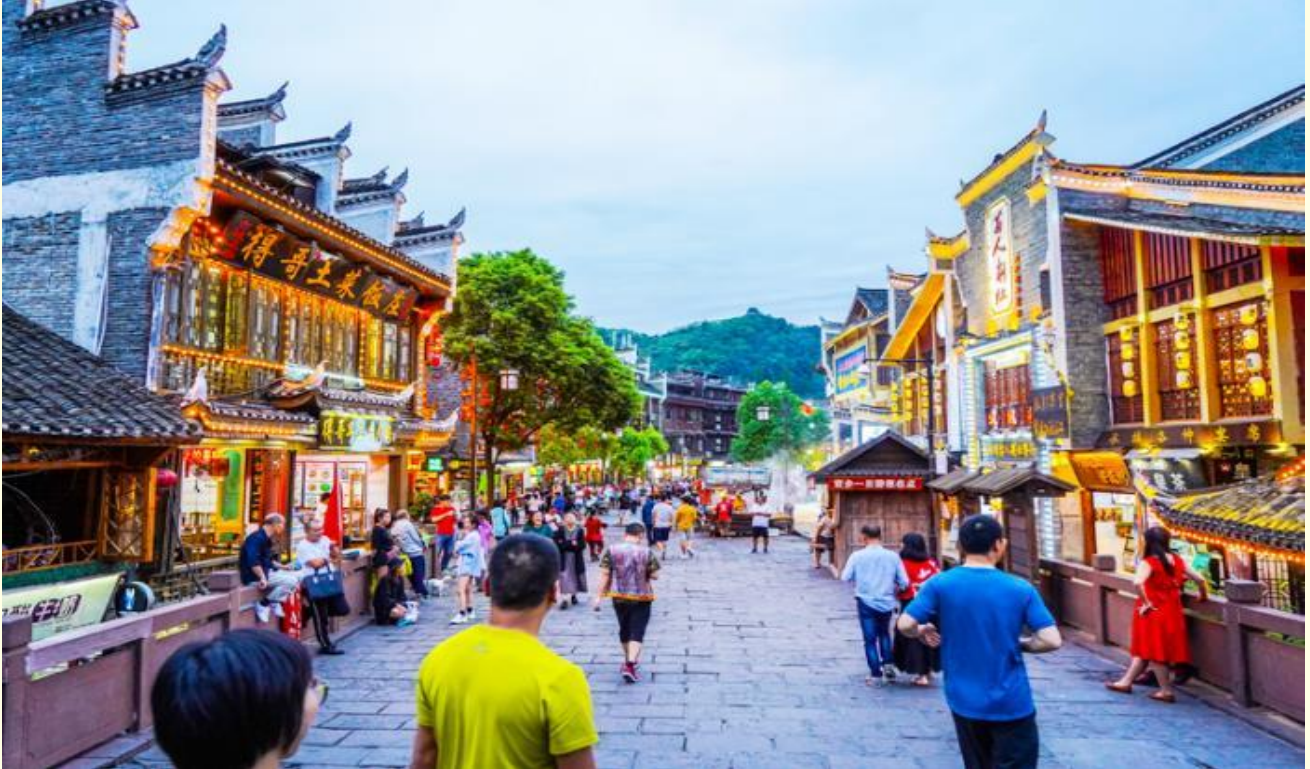
นำท่านชม สะพานสายรุ้ง สะพานไม้โบราณที่มีหลังคาคลุมเหมือนสะพานข้ามคลองในเวนิส สะพานแห่งนี้เคยเป็นด่านเก็บภาษีเกลือในสมัยราชวงศ์ชิง ซึ่งยังคงรักษารูปทรงในอดีตไม่เปลี่ยนแปลง