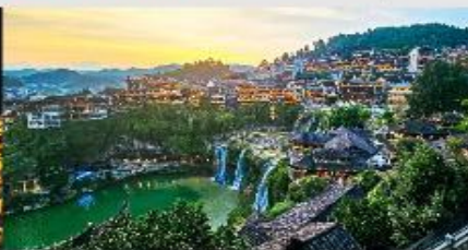
ฝูหรงเจิน