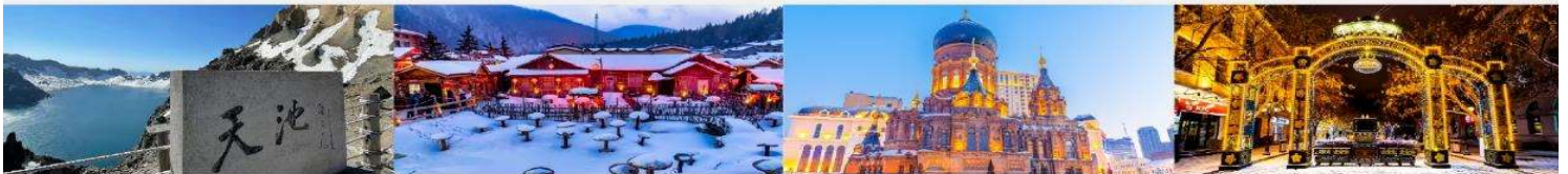
อุทยานจางไปซาน