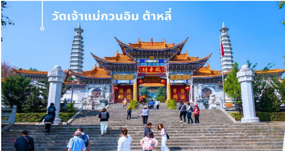
วัดเจ้าแม่กวนอิม ต้าหลี่

CMUK1 คุณหมิง-ต้าหลี่-แซงกริล่า-ลี่เจียง 6 วัน 5 คืน บิน MU China Eastern Airline (NOV-DEC24)