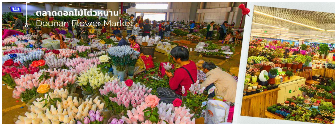
ตลาดดอกไม้ไต้หวัน Dounan Flower Market

นำท่านชม ตลาดดอกไม้ไต้หวัน เป็นตลาดค้าส่งดอกไม้ที่ใหญ่ที่สุดของจีน เปิดทำการค้าตลอด 24 ชั่วโมง ไม่มีช่วงเวลาปิดทำการ โดยในปี 2566 ตลาดดอกไม้ไต้หวันมีปริมาณการซื้อขายดอกไม้โดยเฉลี่ยรวม 13,540 ล้านบาท คิดเป็นมูลค่า 13,570 ล้านบาท ถือเป็นตลาดค้าปลีก-ส่ง ผลิตผลทางการเกษตรที่ใหญ่ที่สุดในประเทศจีนอีกด้วย