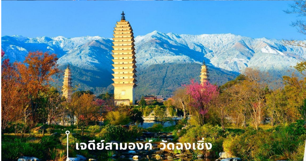
เจดีย์สามองค์ วัดจงเซ็ง