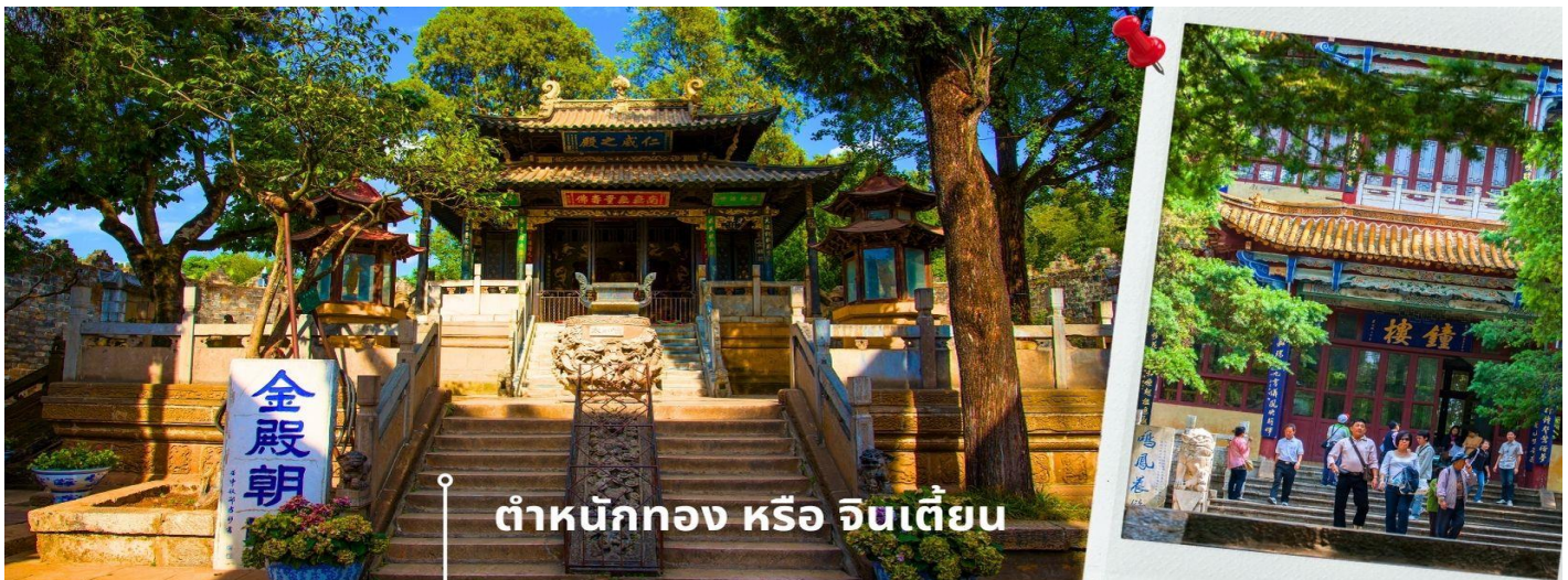
ต้าหนักทง หรือ จินเตี้ยน

เที่ยง ๑๐ | รับประทานอาหารกลางวันที่ภัตตาคาร (14) นำท่านเยี่ยมชม ต้าหนักทง หรือ จินเตี้ยน (The Golden Temple Park | Jindian park) (ไม่รวมค่ารถแบดเตอร์ 10 หยวน/ท่าน) โบราณสถานสำคัญของมณฑลยูนนาน ที่ได้รับการปกป้องดูแลโดยรัฐบาลจีน ตั้งอยู่บริเวณเชิงเขาหมิงเฟิง ล้อมรอบด้วยแนวกำแพงและหอคอยเหมือนเป็นป้อมปราการ ต้าหนักทงถูกเรียกตามลักษณะอาคารที่มีสีทองอร่าม จากทองเหลืองในส่วนของผนังและหลังคา รวมกว่า 200 ตัน โดยถือเป็นสิ่งปลูกสร้างสัมฤทธิ์ที่ใหญ่ที่สุดของจีน ภายในมีรูปปั้นทองโดยมีเงินอยู่ (เสวียนฮู่) เทพเจ้าลัทธิเต๋าเป็นองค์ประธาน