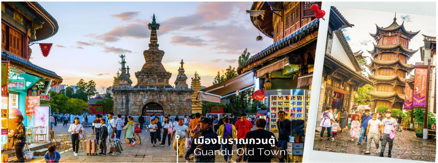
เมืองโบราณกวนตุ๋ Guandu Old Town

CMUK1 คุณหมิง-ต้าหลี่-เซี่ยงไฮ้-ฉางกรี่ล่า-ลี่เจียง 6 วัน 5 คืน บิน MU China Eastern Airline (NOV-DEC24)