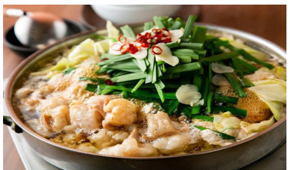
มตสึนาเบะ (Motsunabe)