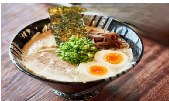
ฮากาตะราเมง (Hakata Ramen)