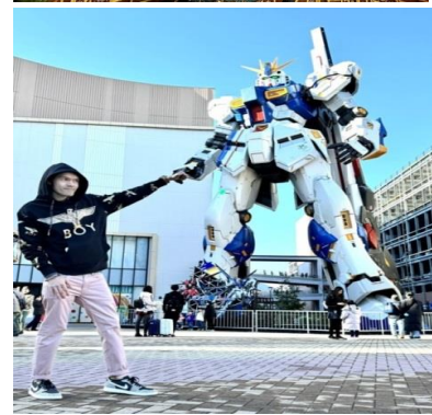
หุ่นกันดั้ม ชื่อ RX93 FF Nu Gundam

เดินทางต่อไปยัง ร้านค้า DUTY FREE ให้ท่านได้ช้อปปิ้งสินค้าปลอดภาษีที่มีคุณภาพ อาทิ เครื่องสำอาง โฟมล้างหน้า(แนะนำ) อาหารเสริม ขนม เครื่องใช้ต่างๆ ฯลฯ ...จากนั้นแวะ แชะรูปกับหุ่นกันดั้มยักษ์ ณ ห้าง LaLaport (หากมีเวลาพอ) มีขนาดใหญ่กว่า Unicorn Gundam ที่โตเกียวและใหญ่กว่า RX93 FF Gundam ที่ Gundam Factory Yokohama เรียกได้ว่าเป็นแลนด์มาร์คสำคัญของเมืองฟูกุโอกะในปัจจุบัน ...จากนั้นอิสระให้ท่านช้อปปิ้ง