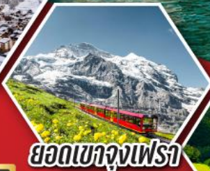
ยอดเขาจุงเฟรา