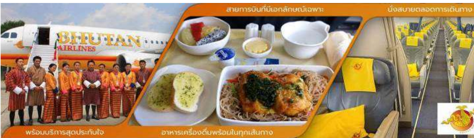
พร้อมบริการสุดประทับใจ

06.30 น. ออกเดินทางสู่ เมืองพาร์ ประเทศภูฏาน โดย สายการบิน BHUTAN AIRLINE เที่ยวบินที่ B3-701 (มีบริการอาหารและเครื่องดื่มบนเครื่อง) (เครื่องบินแวะรับส่งผู้โดยสารที่เมืองกัลกัตตา ประเทศอินเดียประมาณ 45 นาที ***ไม่ต้องลงจากเครื่อง*** )