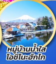
หมู่บ้านน้ำใส โอชิโนะอ๊กไก