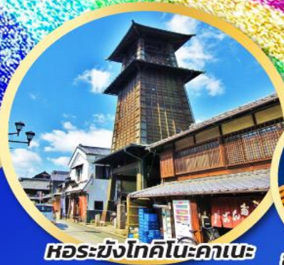
หอรบั้งโทคิโนะคาเนะ