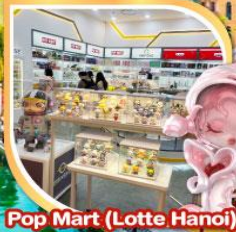
Pop Mart (Lotte Hanoi)