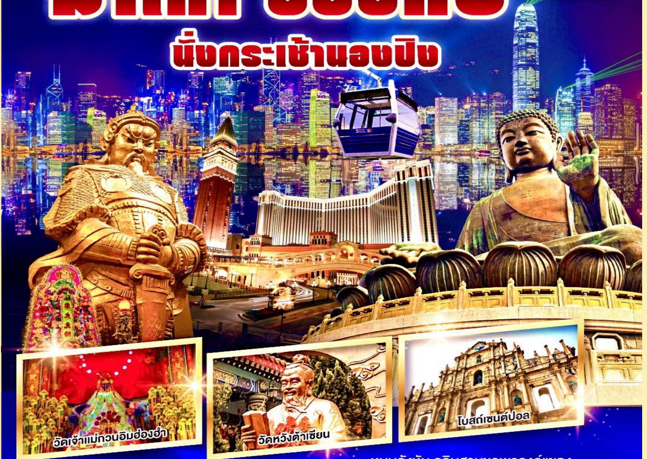
วัดเจ้าแม่กวนอิมฮ่องกง