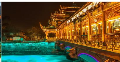
สะพานหนานเจียว