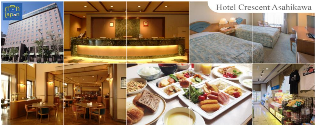
Hotel Crescent Asahikawa

รับประทานอาหารเย็น ณ ภัตตาคาร (2) HOTEL CRESCENT ASAHIKAWA หรือเทียบเท่าระดับเดียวกัน