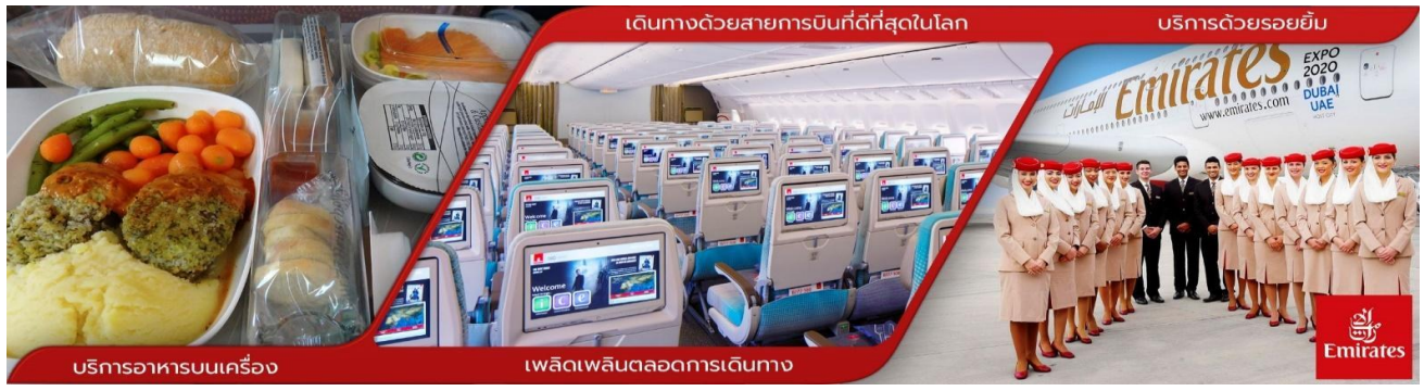
บริการอาหารบนเครื่อง

23.00 คณะพร้อมกันที่ สนามบินสุวรรณภูมิ ชั้น 4 ประตู 9 บริเวณเคาน์เตอร์ T โดยมีเจ้าหน้าที่ของบริษัทคอยต้อนรับเพื่ออำนวยความสะดวกด้านเอกสาร ออกบัตรที่นั่งและโหลดสัมภาระในท่าน 01.50 ออกเดินทางจากกรุงเทพฯ โดยสายการบินเอมิเรตส์ EMIRATES AIRLINE เที่ยวบินที่ EK 385 สู่อากาศยานนานาชาติดูไบ สหรัฐอาหรับเอมิเรตส์ (มีบริการอาหาร และเครื่องดื่มบนเครื่อง)