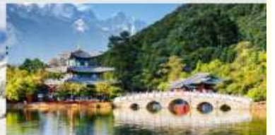
สระมิงกรต้า

*ทางบริษัทฯ ขอสงวนสิทธิ์ในการสลับโปรแกรมทัวร์ตามความเหมาะสมขึ้นอยู่กับสถานการณ์ปฏิบัติงาน โดยค่าใช้จ่ายดังผลประโยชน์ของลูกค้าเป็นสำคัญ