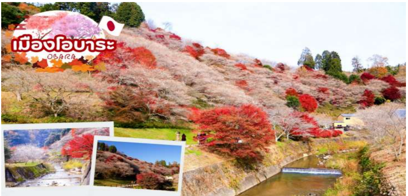
GO2NGO-TG033--AUTUMN KAMIKOCHI HAKUBA OBARA 7D 4N BY TG

เมืองโอบาระ นำท่านเดินทางชมความมหัศจรรย์ของธรรมชาติที่ ซากุระจะเบ่งบานพร้อมกับใบไม้เปลี่ยนสี (ขึ้นอยู่กับสภาพอากาศ) ซากุระพันธุ์นี้มีชื่อว่า ชิคิซากุระ (Shikizakura) เป็นซากุระสายพันธุ์ที่หายากมาก ๆ โดยมีความพิเศษที่แตกต่างจากซากุระทั่ว ๆ ไป คือ บาน 2 ครั้งต่อปี ดอกชิคิซากุระ (Shikizakura) จะเริ่มบานในช่วงกลางเดือนมีนาคมในฤดูใบไม้ผลิและจะบานอีกครั้งเดือนพฤศจิกายนในฤดูใบไม้ร่วง ใครที่พลาดชมซากุระในช่วงเดือนมีนาคมที่ผ่านมา สามารถมาชมความสวยงามของดอกซากุระในฤดูใบไม้เปลี่ยนสีเดือนพฤศจิกายนได้ที่นี้ ให้ท่านได้เพลิดเพลินกับความสวยงามของธรรมชาติตามอัธยาศัย