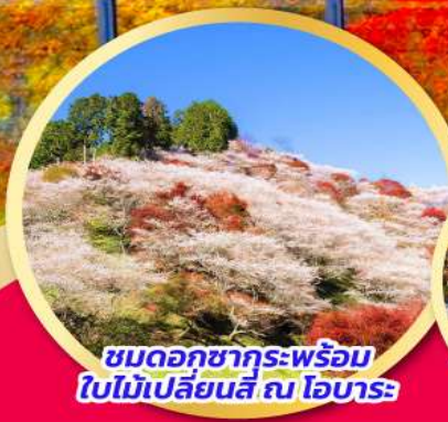
ชมดอกซากุระพร้อม ใบไม้เปลี่ยนสี ณ โอบาระ