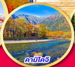
คามิโคจิ