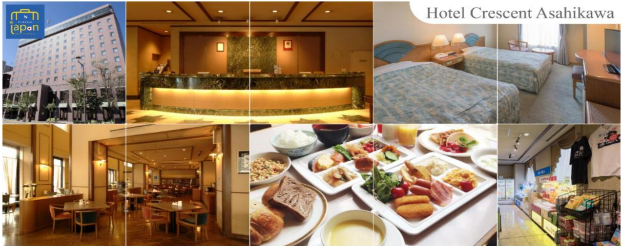
Hotel Crescent Asahikawa

ค่าที่พักรับประทานอาหารค่ำตามอัตราค่า HOTEL CRESCENT ASAHIKAWA หรือเทียบเท่าระดับเดียวกัน