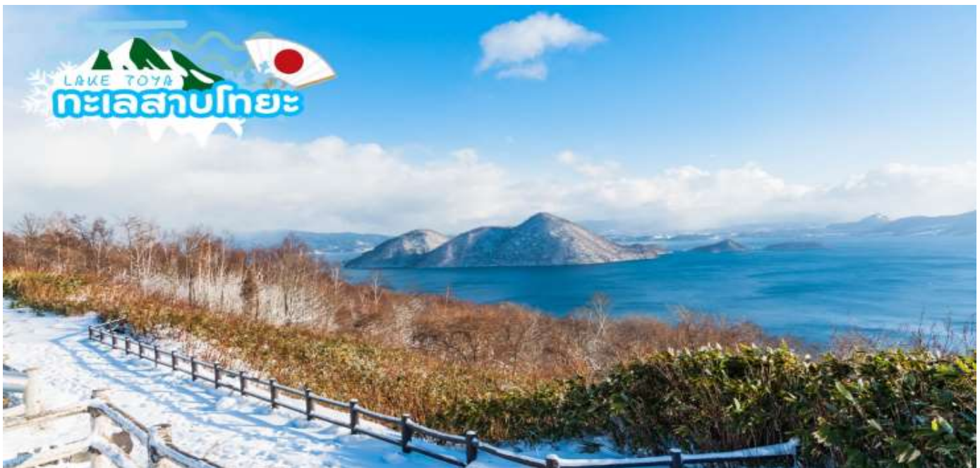
GO2CTS-TG031--HOKKAIDO HAKADATE SKI WINTER 6D4N BY TG

นำท่านชม หุบเขานรกจิโกกุดานิ (Jigokudani) หรือเรียกอีกอย่างว่า “หุบเขานรก” อยู่ในเขตอุทยานแห่งชาติ Shikotsu-Toya เมือง Noboribetsu ที่เรียกว่าหุบเขานรกนั้น เพราะที่นี่มีทั้งบ่อโคลนและบ่อน้ำร้อนที่เดือดตามธรรมชาติกระจายไปทั่วบริเวณที่มีควันร้อน ๆ พวยพุ่งขึ้นมาอยู่ตลอดเวลา และถือเป็นแหล่งกำเนิดน้ำแร่และออนเซ็นที่มีชื่อเสียงที่สุดบนเกาะฮอกไกโด ทางเข้าหุบเขาจะมีสัญลักษณ์เป็นยักษ์สีแดงตัวใหญ่ถือตะบองคอยต้อนรับเป็นยักษ์ที่คอยคุ้มกันภัยให้ผู้มาเยือนดังนั้นทุกบริเวณพื้นที่ของที่นี่ไม่ว่าจะเป็นร้านขายของที่ระลึกห้องน้ำจะมีป้ายต่าง ๆ ที่มีสัญลักษณ์รูปยักษ์ให้เห็นโดดเด่นเป็นเอกลักษณ์