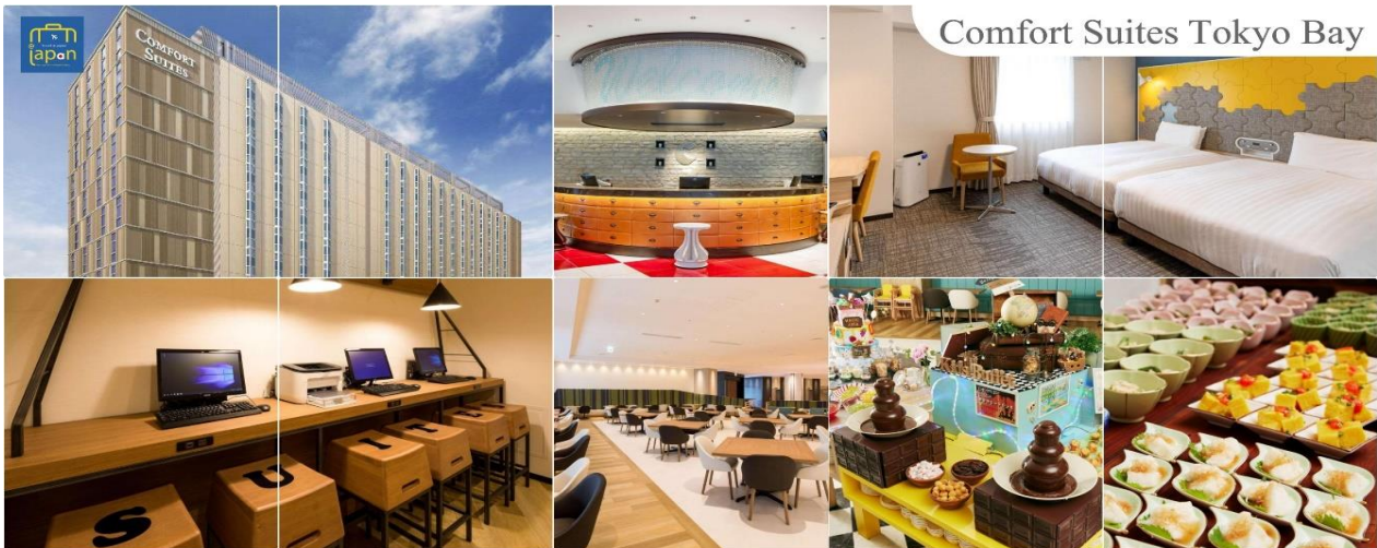
Comfort Suites Tokyo Bay

พักที่ COMFORT SUITES TOKYO BAY หรือเทียบเท่าระดับเดียวกัน