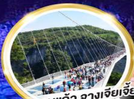
สะพานแกว่ จางเจียเจีย