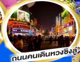
ถนนคนเดินหวงซิงฮู