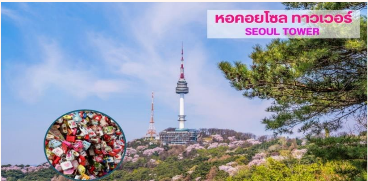
หอคอยโซล ทาวเวอร์ SEOUL TOWER

นำท่านเดินทางสู่ SEOUL TOWER หรือ นัมซาน ทาวเวอร์ (N Seoul Tower) (ไม่รวมลิฟท์ขึ้นหอคอย) เป็นหนึ่งในแหล่งท่องเที่ยวสำคัญของเมืองโซล เปิดให้บริการมาตั้งแต่ปี 1980 ตั้งอยู่บนยอดเขานัมซัง สูง 236 เมตร ให้วิวเมืองโซลและบริเวณรอบๆแบบ พาโนรามา นับว่าเป็นหนึ่งในทาวเวอร์ที่ให้วิวสวยที่สุดในเอเชียโซลทาวเวอร์ได้รับการ renovate ใหม่ปี 2005 จึงได้ชื่อใหม่เป็น N Seoul Tower โดย N ที่เพิ่มขึ้นมานั้นย่อมาจาก new look หรือ รูปแบบใหม่ โดยมีการปรับเปลี่ยนและพัฒนาการต่างๆ ทั้งการให้แสงไฟที่หลากหลายและสวยงามขึ้น รวมถึงภายในที่ตกแต่งใหม่