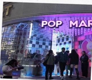
ถนนนานกิง