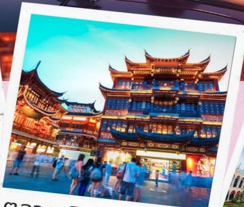
ตลาดเจิ้งหวังเมี่ยว