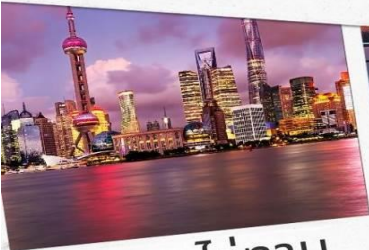
หาดว่อกาน