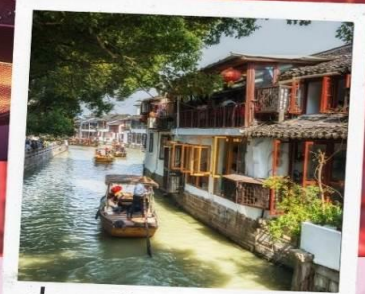
ล่องเรือจูเจียเจี้ยว