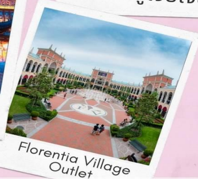
Florentia Village Outlet