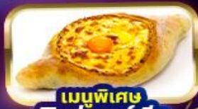
เมนูพิเศษ พิซซ่าจอร์เจีย Khachapuri

พิพิธภัณฑน์ โจเซฟ สตาลิน เมืองถ้ำโบราณ อุทยานแห่งชาติบอร์โจบี โบสถ์เกลลาตี เข้าชมถ้ำโพรมีธีอุส โบสถ์เมเตห์คี สะพานสันติภาพ นั่งกระเช้าเคเบิลขึ้นชมป้อมนาริกาลา โรงอาบน้ำโบราณ อะบาโนตุนานี วิหารสเวตสเคอเวรี มหาวิหารจวารี อนุสาวรีย์ประวัติศาสตร์จอร์เจีย