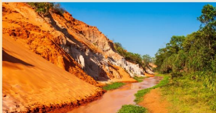
ลำธารนางฟ้า