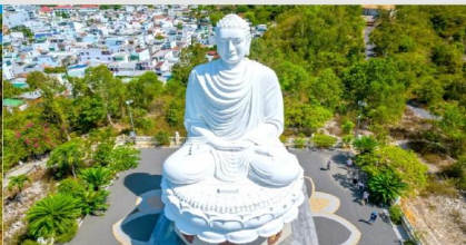
วัดลองเซิน