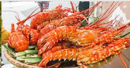
Nha Trang Night Market

*ทางบริษัทฯ ขอสงวนสิทธิ์ในการสลับโปรแกรมทัวร์ตามความเหมาะสมขึ้นอยู่กับสถานการณ์หน้างาน โดยคำนึงถึงผลประโยชน์ของลูกค้าเป็นสำคัญ