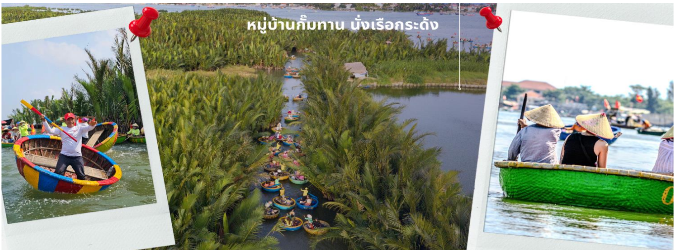
หมู่บ้านกัมทาน นั่งเรือกระดิง

จากนั้นนำท่านผ่านชม ภูเขาหินอ่อน Marble Mountains และนำท่านเข้าชม หมู่บ้านแกะสลักหินอ่อน ที่มีแหล่งวัดถูปหินอ่อนเนื้อดี และช่างแกะสลักฝีมือประณีต ส่งออกจำหน่าย ทั่วโลก จากนั้นนำท่านเดินทางสู่ หมู่บ้านกัมทาน สนุกสนานไปกับการเล่นกิจกรรม นั่งเรือกระดิง เป็นหมู่บ้านเล็กๆในเมืองฮอยอันตั้งอยู่ในสวนมะพร้าวริมแม่น้ำ ในอดีตช่วงสงครามที่นี่เป็นที่พักอาศัยของเหล่าทหาร อาชีพหลักของคนที่นี่คืออาชีพ