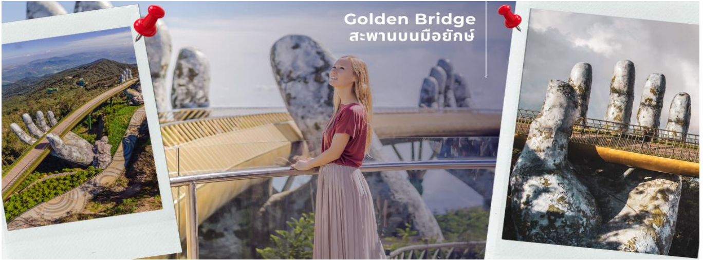
Golden Bridge สะพานบนมือยักษ์

REVISED CFDD4 ดานัง-ฮอยอัน-พักบานาฮิลล์ 3 วัน 2 คืน FD (NOV24-APR25)