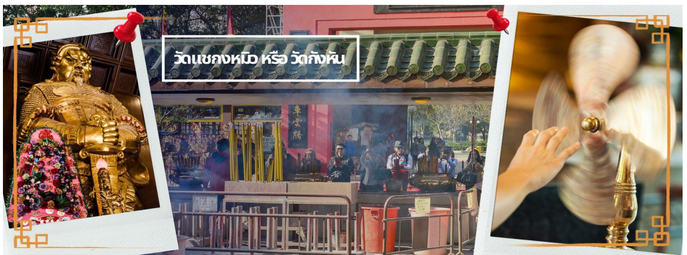
วัดแชกงหมิว หรือ วัดกั๊กหัน

จากนั้นนำท่านเดินทางไป วัดแชกงหมิว หรือ วัดกั๊กหัน (CHE KUNG TEMPLE) วัดแชกงสร้างขึ้นเพื่อเป็นอนุสรณ์เพื่อรำลึกถึงตำนานแห่งนักรบราชวงศ์ซ่ง มีนามว่า “แช กง” แม่ทัพปราบศึก ผู้คนทั่วทุกดินแดนต่างยำเกรงในกำลังพลอันกล้าหาญแข็งแกร่งของแม่ทัพแชกง เป็นวัดเก่าแก่ที่มีความศักดิ์สิทธิ์มาก มีอายุกว่า 300 ปี ตั้งอยู่ในเขต SHATIN มีประวัติเล่าต่อกันมาว่า ขณะที่แม่ทัพปราบศึก อยู่ที่นี่ ทุกแคว้นเขตแดนแผ่นดินใหญ่ต่างก็ยกมาเกรงต่อกำลังพลที่กล้าหาญในกองทัพของท่าน ยามที่ออกรบเพื่อต้านข้าศึกศัตรูทุกทิศทาง ทุก ๆ ครั้งท่านใช้สัญลักษณ์รูปกั๊กหัน 4 ใบพัดติดไว้ด้านหลังรถศึกนำ ขบวนในกองทัพ เหล่าทหารกล้ามีความเชื่อว่าเมื่อพกพาสัญลักษณ์รูปกั๊กหันนี้ไป ณ ที่ใด ๆ กั๊กหันนี้จะช่วยเสริมสิริมงคล นำพาแต่ความโชคดี มีอำนาจเข้มแข็ง เสริมกำลังใจให้แก่กองทัพของท่าน ชื่อเสียงในการนำทัพสู้ศึกของท่านจึงเป็นตำนานมาจนทุกวันนี้ ปัจจุบันวัดแชกงจึงเป็นสถานที่สักการะเคารพ ขอพร ท่านแชกง โดยมีสัญลักษณ์เป็นกั๊กหันนำโชคนั่นเอง 🌀 การหมูนกั๊กหันนำโชคที่ตั้งอยู่ในวัด เพื่อจะได้หมูนเวียนชีวิตของเราและครอบครัวให้มีความเจริญก้าวหน้าด้านหน้าที่การงาน โชคลาภ ยศศักดิ์ และถ้าหากคนที่ดวงไม่ดีมีเคราะห์ร้ายก็ถือว่าเป็นการช่วยหมูนับเป่าเอาสิ่งร้ายและไม่ดีออกไปให้