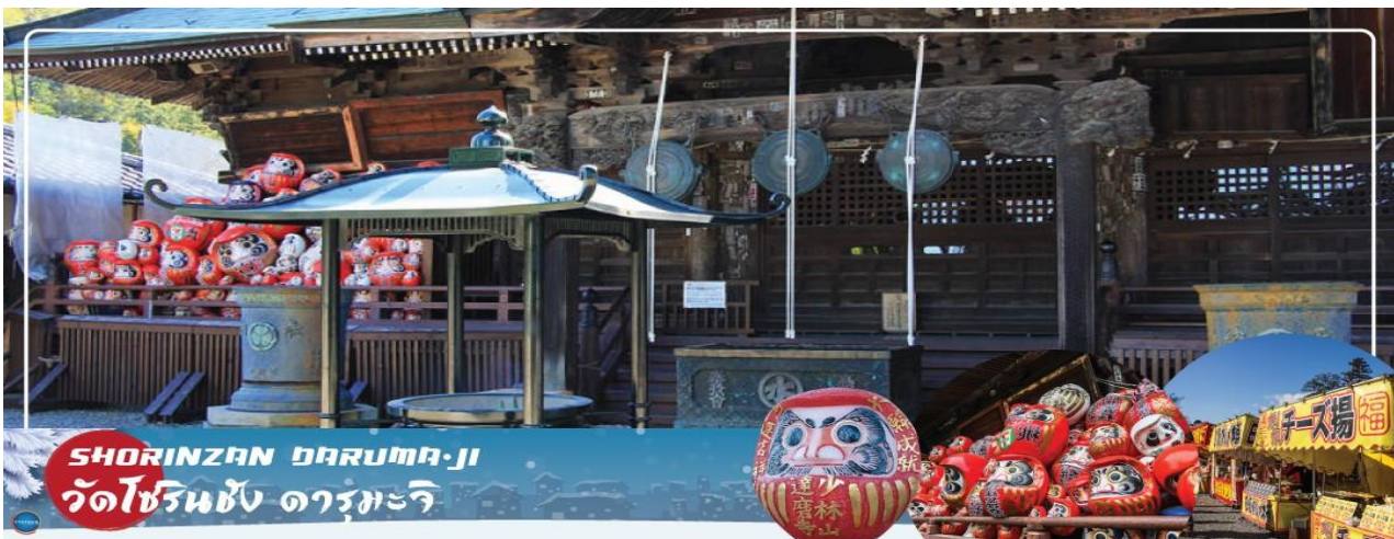
วัดโชรินซัง ดารุมะจิ

จากนั้นนำท่านเดินทางสู่เมือง ทาคาซากิ เพื่อเยี่ยมชม วัดโชรินซัง ดารุมะจิ (SHORINZAN DARUMA-JI) (ใช้เวลาเดินทางประมาณ 2 ชั่วโมง) วัดนี้สร้างขึ้นในปี 1697 และกล่าวกันว่าเป็นสถานที่ต้นกำเนิดตุ๊กตาดารุมะของญี่ปุ่น ตุ๊กตามีหมวดเครายอดนิยมนี้เป็นเครื่องรางนำโชค ตามธรรมเนียมแล้ว เมื่อท่านต้องการขอพรให้เต็มดวงตาข้างหนึ่งของตุ๊กตา และเมื่อพรที่ขอไว้เป็นจริง ค่อยเติมตาอีกข้างหนึ่ง แล้วพอลถึงช่วงสิ้นปี ก็ให้นำตุ๊กตาดังกล่าวมาเผาที่นี้ วัดแห่งนี้เต็มไปด้วยตุ๊กตาดารุมะที่มีขนาดและสีสันหลากหลาย ซึ่งแต่ละที่ก็สื่อถึงความหมายแตกต่างกัน สีแดงเป็นสีที่พบบ่อยที่สุด และเป็นสีสำหรับนำโชคลาก โดยตุ๊กตาดารุมะที่นี้จะมีให้เราเลือกหลายสี หลายขนาดและราคา