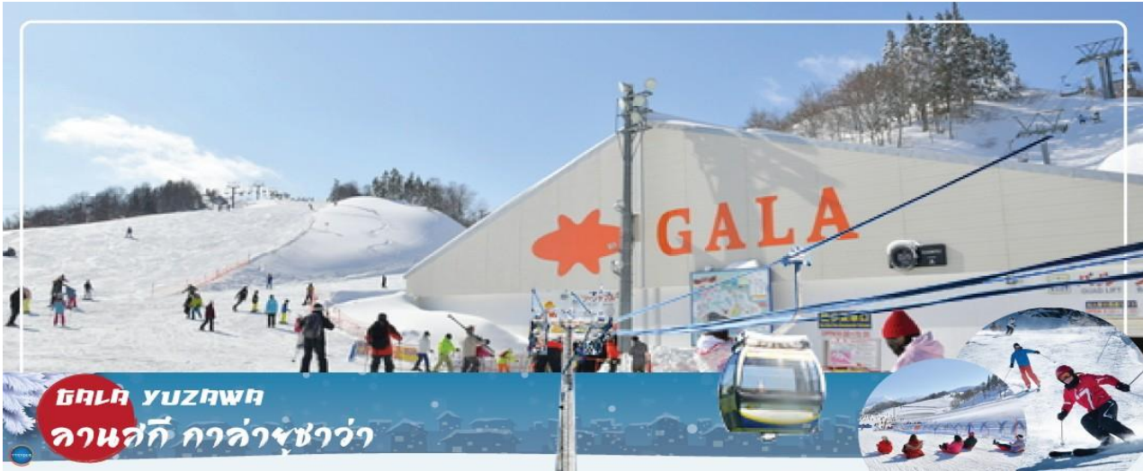
ลานสกี กาล่ายูซาวา

วันที่สี่ เมืองกุนมะ – เมืองยุซาวา – ลานสกี กาล่ายูซาวา (GALA YUZAWA) – วัดโชรินซัง ดารุมะจิ – กรุงโตเกียว – ย่านโอไดบะ – ห้างไดเวอร์ซิตี