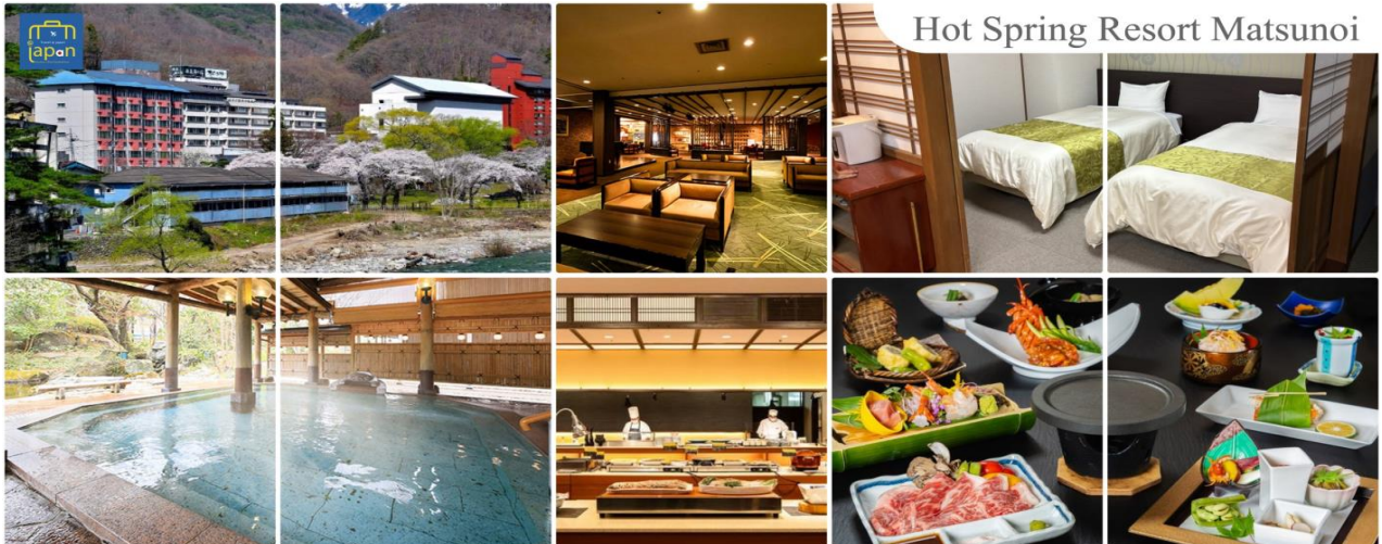
Hot Spring Resort Matsunoi

รับประทานอาหารค่ำ ณ ภัตตาคาร ของโรงแรม (5) --- บุฟเฟต์นานาชาติ หลังอาหารให้ท่านได้ผ่อนคลายกับการแช่น้ำแร่ธรรมชาติ เชื่อว่าถ้าได้แช่น้ำแร่แล้ว จะทำให้ ผิวพรรณสวยงามและช่วยให้ระบบหมุนเวียนโลหิตดีขึ้น