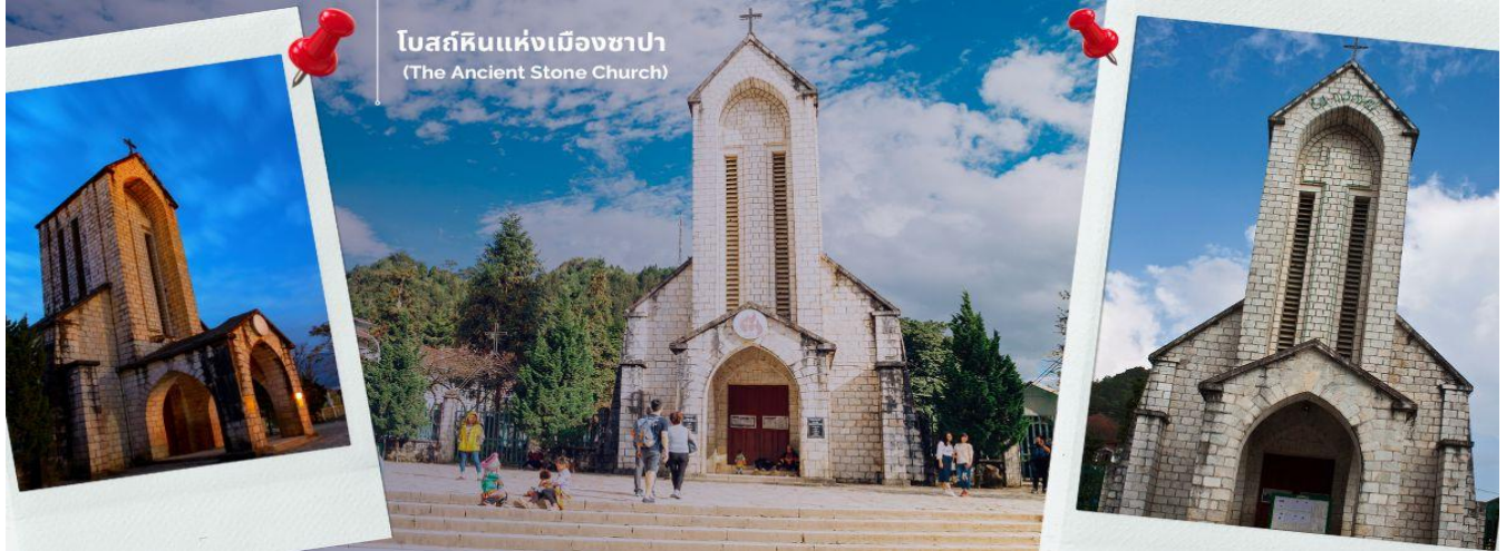
โบสถ์หินแห่งเมืองซาปา (The Ancient Stone Church)

นำท่านช้อปปิ้งที่ ตลาดไนต์เมืองซาปา มีสินค้าให้ท่านเลือกช้อปปิ้งมากมาย ไม่ว่าจะเป็นสินค้าพื้นเมืองของฝาก ขนม กระเป๋า รองเท้า ท่านสามารถช้อปปิ้งได้อย่างจุใจ