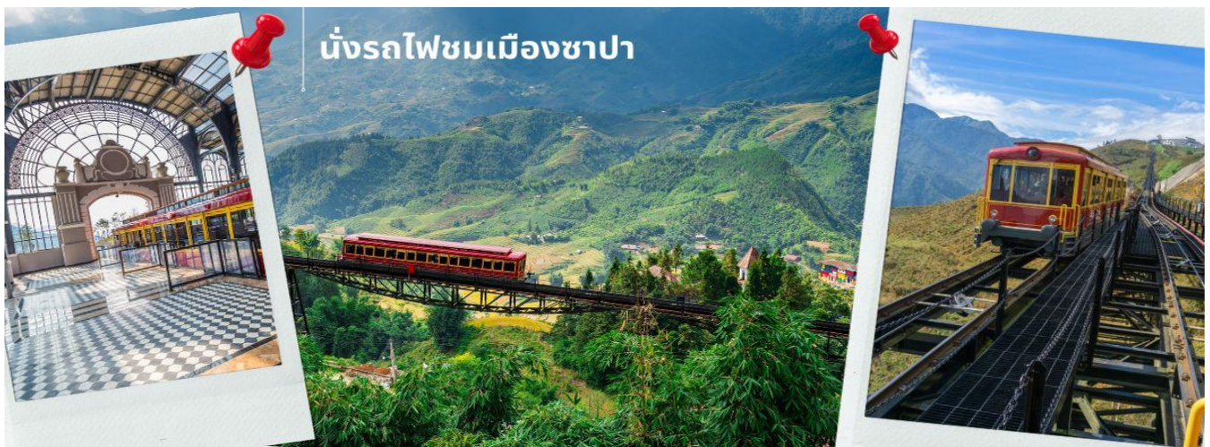
นั่งรถไฟชมเมืองซาปา

นำท่าน นั่งรถไฟชมเมืองซาปา (รวมค่ารถไฟชมเมือง) ท่านจะได้พบกับวิวทิวทัศน์ของเมืองซาปาที่เต็มไปด้วยความสดชื่น และสุดกลืนอายธรรมชาติ และยังตื่นตาไปด้วยวิวภูเขา และนาขั้นบันได ที่มีชื่อเสียงของเมืองซาปาอีกด้วย ความยาวประมาณ 2 กิโลเมตร โดยใช้เวลาประมาณ 20 นาทีเพื่อไปสู่สถานีขึ้นกระเช้าที่จะนำท่านขึ้นสู่ยอดเขาฟานซีปัน