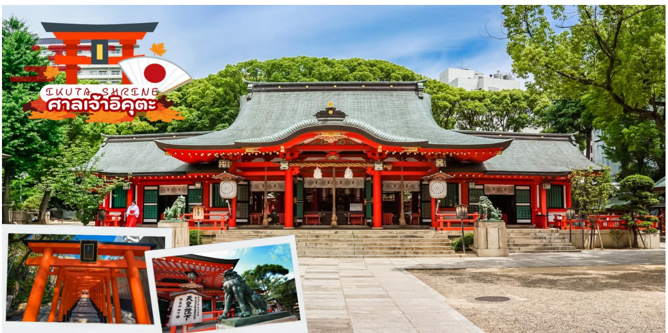
GO2KIX-TG0009--AUTUMN AND WINTER IN KANSAI 6D4N BY TG

นำท่านขอพรความรัก ศาลเจ้าอิคุตะ ตั้งอยู่ใจกลางเมืองโกเบ มีประวัติความเป็นมายาวนานกว่า 1800 ปี มีเทพเจ้าแห่งสายสัมพันธ์อยู่ ภายในเขตวัดนอกจากศาลเจ้าหลักแล้วยังมีศาลเจ้าเล็กๆ อยู่อีกมากมาย หนึ่งในเสน่ห์ของศาลเจ้านี้ก็คืออิคุตะโนะโมริที่เต็มไปด้วยสีเขียว