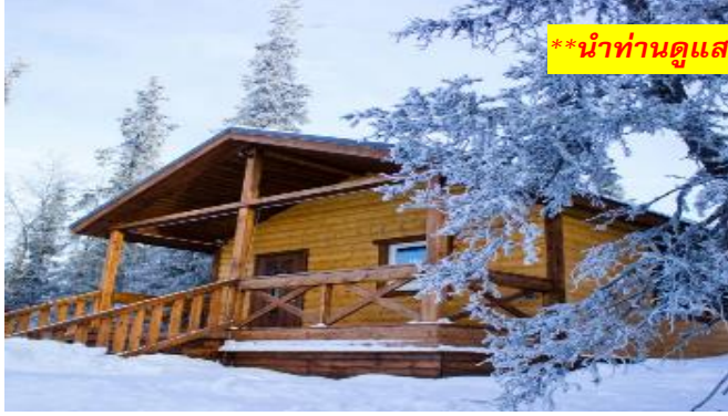
**นำท่านดูแสงเหนือ ณ ที่พัก**

ค่ำ รับประทานอาหารพื้นเมือง ณ ที่พัก พิเศษ...ให้ทุกท่านได้ชิมเนื้อกวางเรนเดียร์