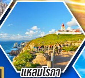
แหลมโรกา