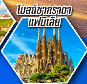
โบสถ์ซากราดา แฟมิลีย