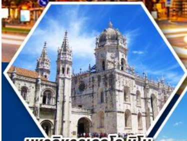
มหาวิหารเจโรนิโม