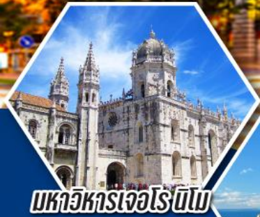
มหาวิหารเจอโรนีโม

ฟรี ประกันสุขภาพ และอุบัติเหตุ คุ้มครองสูงสุด 3,000,000 GTP Plus (Gold Plan) ไทยวิวัฒน์