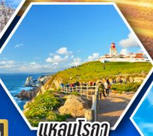
แหลมโรคา