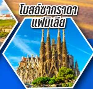
โบสถ์ซากราดา แฟมิลีย