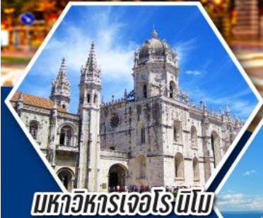
มหาวิหารเจโรนิโม