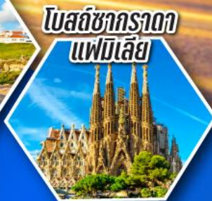
โบสถ์ซากราดา แฟมิลีย