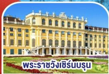
พระราชวังฮ็อบบูร์ก