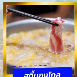
สุกั่มองโก