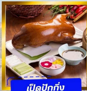
เปิดปักกิ่ง