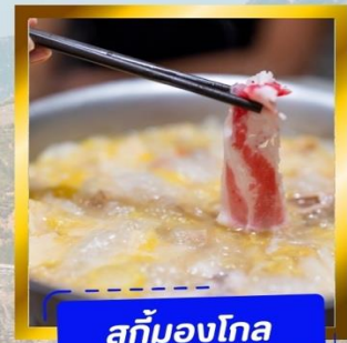
สุกั่มองโก