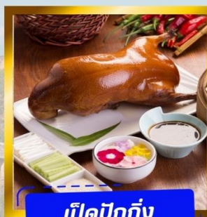
เปิดปักกิ่ง